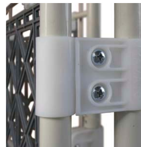
樹脂ジョイント部